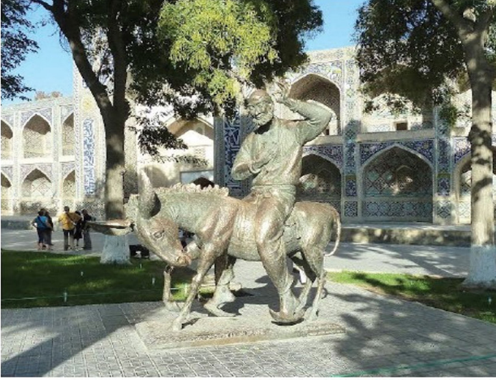
3.13. Görsel: Nasrettin Hoca Heykeli/Buhara-Özbekistan

“Bilim ve Teknoloji” temasında Harezm bölgesinde doğmuş olan Harezmi’nin yaşamının ve çalışmalarının anlatıldığı metne yer verilmiştir (s. 289). Metinle ilgili verilen etkinliklerde de Harezmi’nin nerede doğduğu, çalışmaları gibi sorularla kişiliğine ve doğduğu coğrafyaya dikkat çekilmiştir (s. 290-291). Fakat Harezm bölgesinin konumu ve Türk dünyası ile ilişkisine değinilmemiştir.