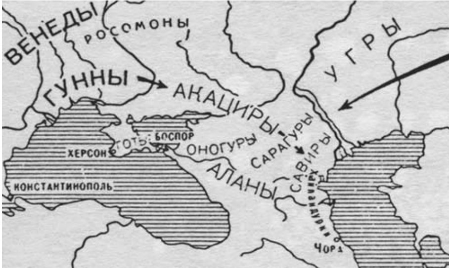
V. Yüzyılda Kafkasyanın Etnik Haritası