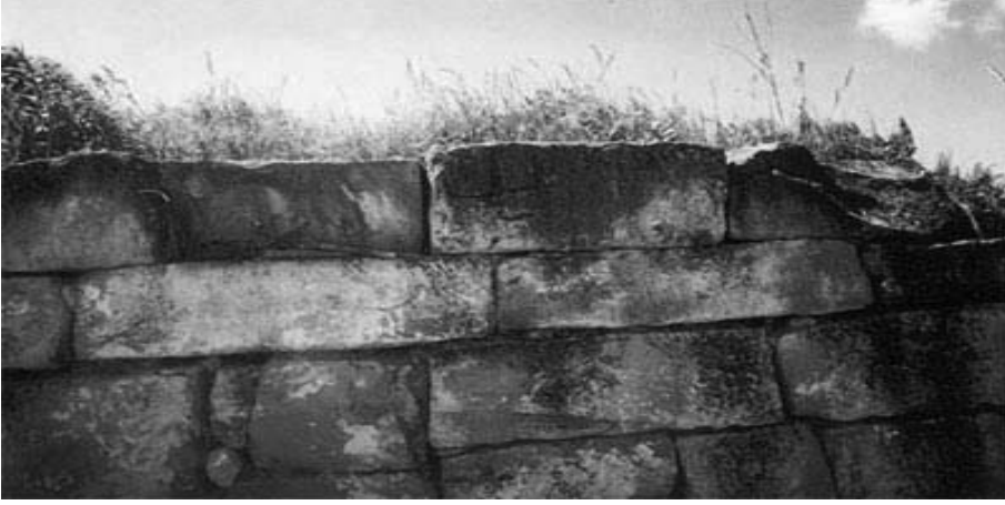
Humara Şehri Kalıntıları

anlaşılmaktadır. Humara müstahkem şehrinin inşa tarihi kesin olarak bilinmemektedir. Konuyla ilgili arkeologlar da kesin bir tarih söyleyememekte, sadece Humara şehri kalıntılarının VIII-X. yüzyıldan daha geç bir döneme ait olamayacağını ifade etmektedirler.