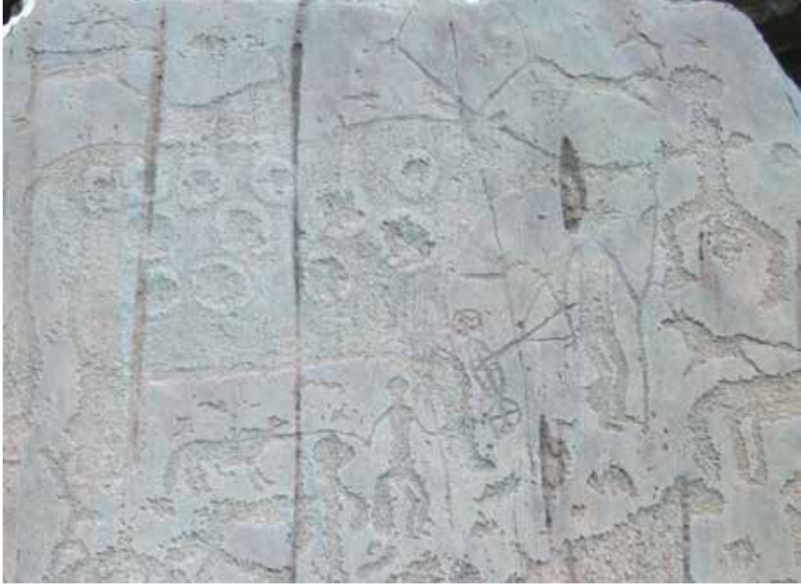
(Altay Özerk Cumhuriyeti sınırları içerisinde yer alan Kalbak Taş bölgesi) 3

Yukarıda görülen ve günümüzde Altay Özerk Cumhuriyeti sınırları içerisinde yer alan Kalbak Taş Bölgesi'ne ait resim, Türk kozmolojisi içerisinde avcılık ritüellerinin canlandırıldığı mit mücadelelerini betimlemektedir. Fotoğrafın sağ üst kısmında belirgin bir şekilde karşılaşmış olduğu hayvanı kalcan ile durdurmaya çalışan bir insan figürü göze çarpmaktadır.