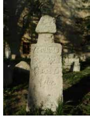
Foto22: Kitabenin batı yönünün görüntüsü