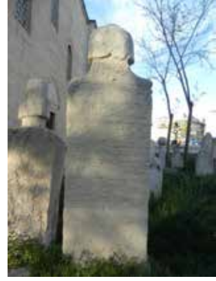
Foto 40: Kitabenin doğu yüzünün görüntüsü