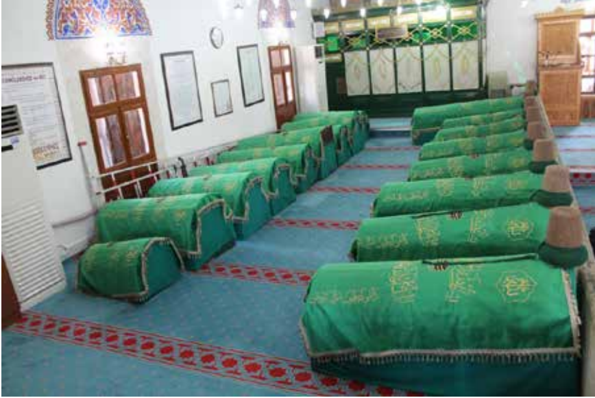
Foto 2: Mader-i Mevlana (Aktekke) Camisi içinde yer alan Mümine Hatun ve çelebilerin sandukaları

İbrahim Hakkı Konyalı, cami içinde yer alan sandukalı mezarlar için şu tespiti yapmıştır: Hepsi adi taş ile yapılmış ve çamurla sıvanmıştır. Hiçbiri çini ile kaplı değildir. Hiçbirinin kitabesi yoktur. Burası Mevlana'nın torunlarının aile makberesi hâline gelmiştir (Konyalı 2005: 240).