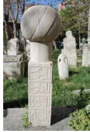
Foto 38: Baş taşının doğu yönünün görüntüsü