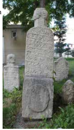
Foto: 26 Kitabenin batı yönünün görüntüsü