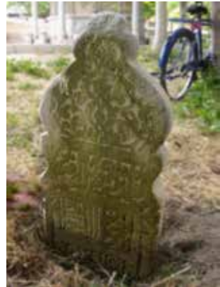
Foto 12: Kitabenin batı yönünün görüntüsü görüntüsü