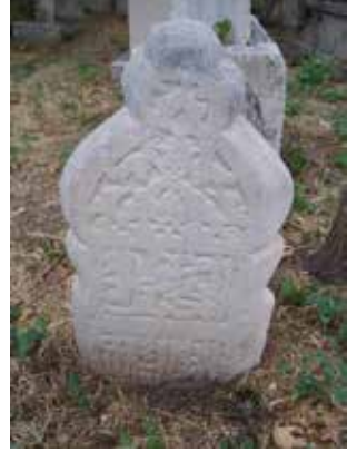
Foto 11: Kitabenin doğu yönünün görüntüsü görüntüsü

Açıklama: Kenarlıklarının kalınlığı, paklarının içten dışa doğru meyilli olması, yazı stili ve rumi süslemeleri, mezar taşının kenarlarında bulunan sütünçeler kitabenin 14. asra ait olduğunu düşündürmektedir. Bugün kitabe varısına kadar toprağa gömülmüş vaziyettedir.