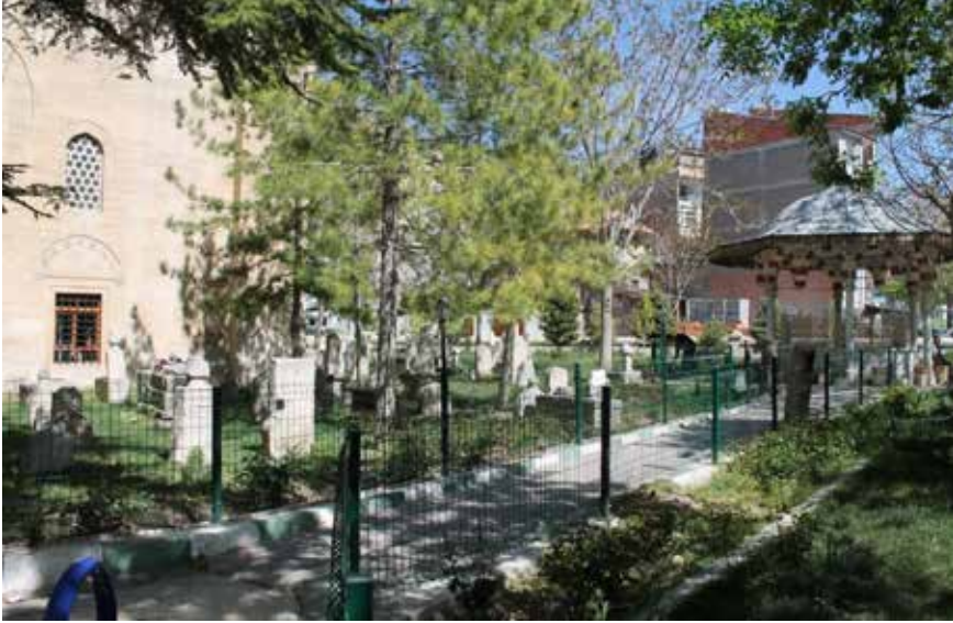
Foto 3: Mader-i Mevlana (Aktekke) Camisi haziresinin batı kısmının görüntüsü