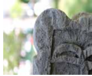
Foto 37: Kitabe üzerine apolet süslemenin görüntüsü