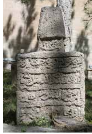
Foto21: Kitabenin dođu yönünün görüntüsü

oğlu 'ali beg maħdûmu ħüseyin ruħuna fâtiħa