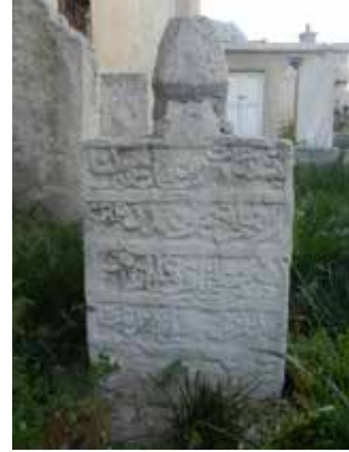
Foto 44: Kitabenin doğu yönünün 2010 yılına ait görüntüsü