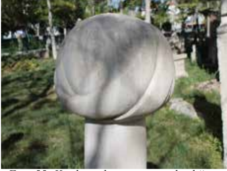
Foto 55: Kitabesiz bir mezar taşı başlığının görüntüsü