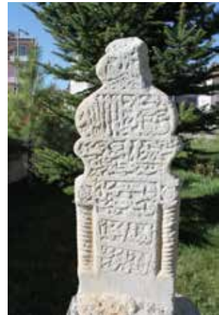
Foto 6: Mezarın baş taşının doğu yönünün görüntüsü