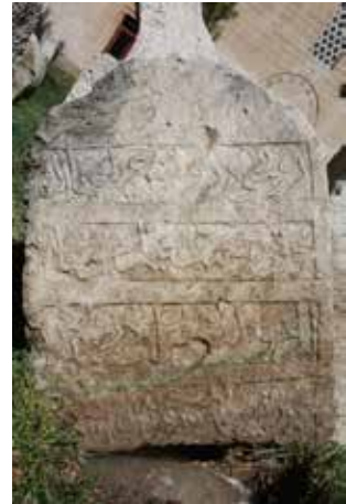
Foto 19: Kitabenin yerinden çıkarılmış, temizlenmiş görünüşü