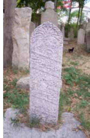
Foto 14: Kitabenin ait olduğu sanduka ile birlikte görüntüsü