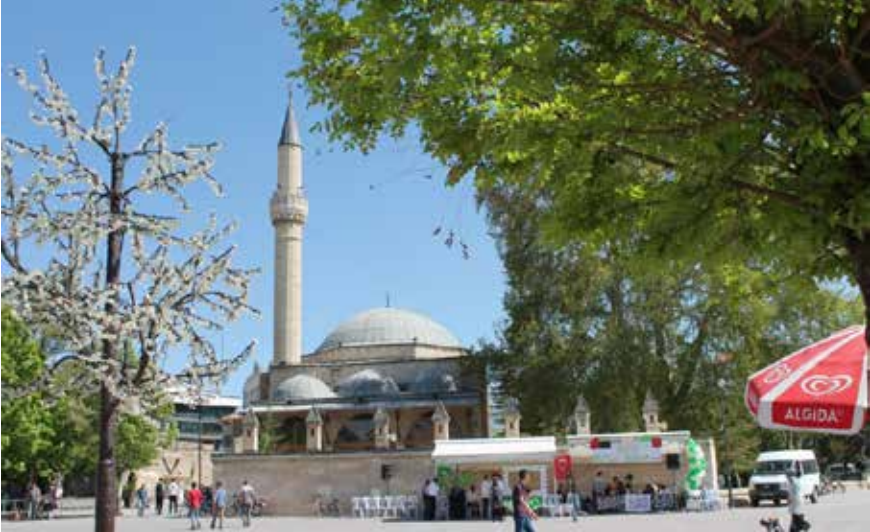
Foto 1: Mader-i Mevlana (Aktekke) Camisinin kuzeybatı yönünden görüntüsü

Mamure, Karaman'ın temiz, mimariye çok elverişli ak taşından yapılmıştır (Konyalı 2005: 229). Bu sebeple külliye Mader-i Mevlana Camisi isminin yanında Aktekke Camisi de denilmektedir. Mader-i Mevlana (Aktekke) Camiinin WGS84 koordinatları şöyledir: Boylam = 33,21363849 o , Enlem= 37,18274515 o .